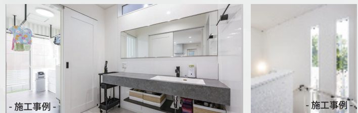
- 施工事例 -