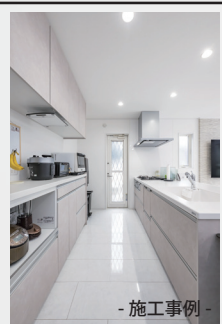
- 施工事例 -