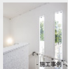
- 施工事例 -