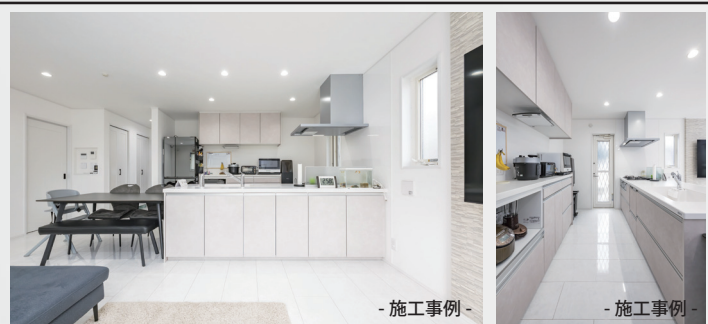
- 施工事例 -