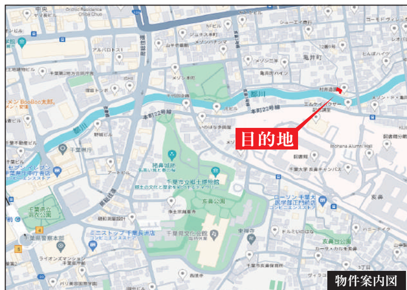
Googleナビ入力 千葉市中央区亀井町 17-17 付近