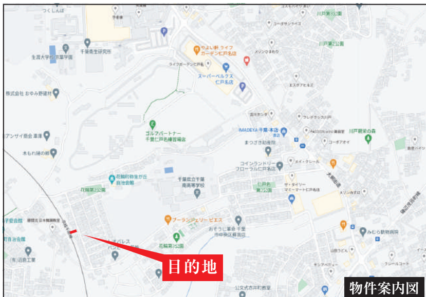
Googleナビ入力 千葉市中央区花輪町38-18付近