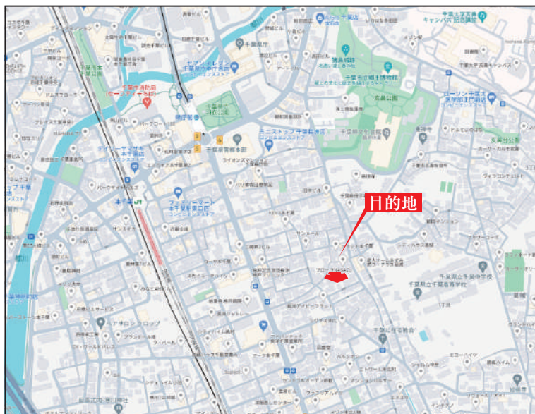
Googleナビ入力 千葉市中央区長洲2丁目30-4付近 物件案内図