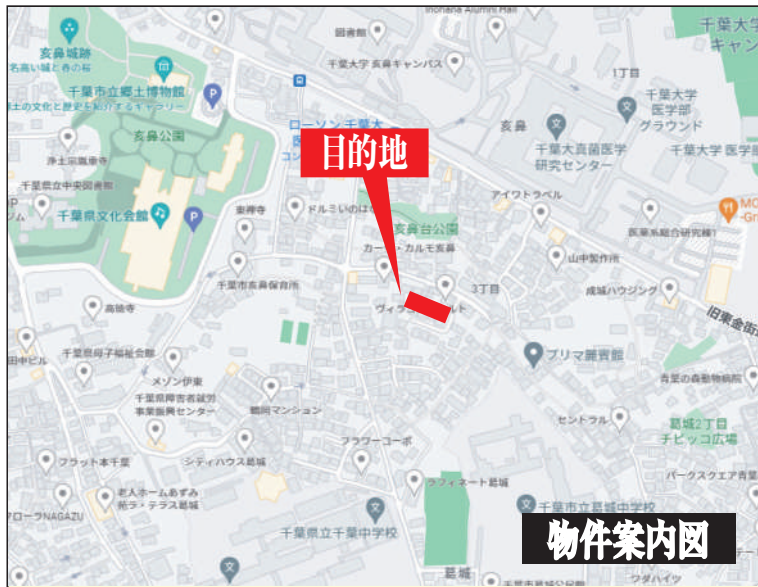
カーナビ入力 千葉市中央区亥鼻3丁目7-18付近