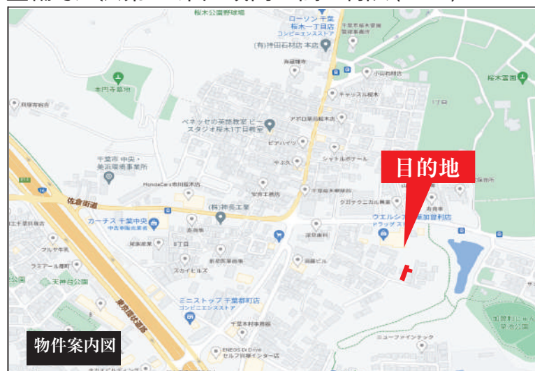
カーナビ入力 千葉市若葉区加曽利町934-28付近