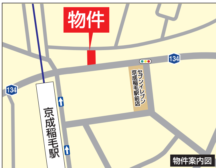
Googleナビ入力 千葉市稲毛区稲毛東2-16-38付近