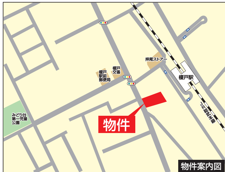
カーナビ入力 千葉県八街市八街ろー173-21付近