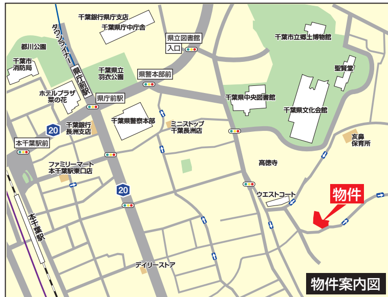
カーナビ入力 千葉市中央区亥鼻2丁目8-16付近