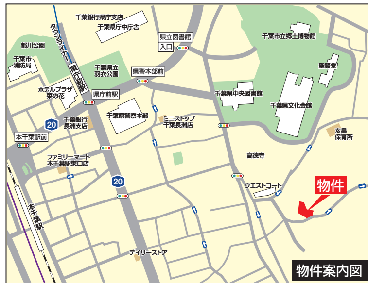
カーナビ入力 千葉市中央区亥鼻2丁目8-16付近